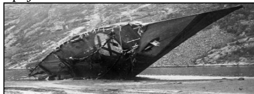
Zničený torpédoborec Bernd von Arnim

důležitý nezamrzající přístav a nedaleký zdroj švédské železné rudy. Střetnutí skončilo vítězstvím Němců, což vedlo k totálnímu obsazení Norska a ústupu Spojenců z této oblasti.