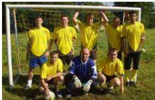
Stepní kozy Libecina

Gratulujeme vítěznému družstvu Stepní kozy Libecina k získání 1. místa v turnaji a putovnímu poháru, na kterém bude umístěn název jejich družstva. Gratulujeme i našemu družstvu za pěkné 2. místo a všem zúčastněným za hladký průběh sportovního klání.