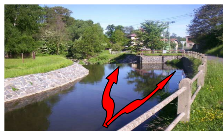
Tok Žejbra a náhonum