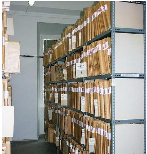
Uložení matrik v archivu – Zámorsk